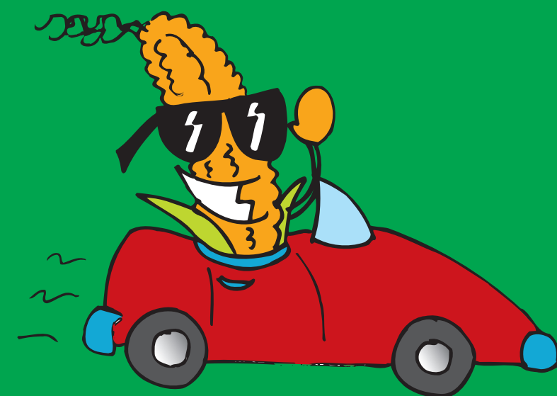
Combustible para Colectivos y autos de Villa María